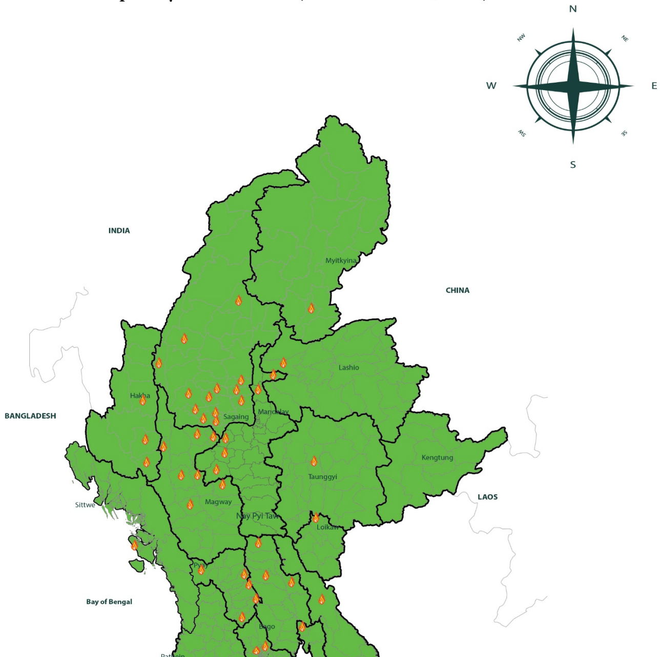
Map of Myanmar Conflict ( December 01-07, 2025 )